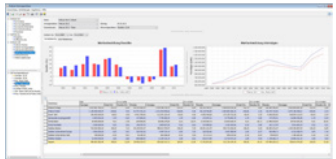
okular OPTIRIS – Analyse der Soll-Ist-Vermögensbilanz inkl. Wertentwicklung