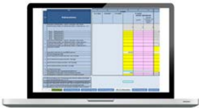
Exemplarischer Meldebogen 2026