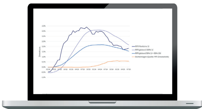
Verlauf von Marktzinssätzen und gleitenden Durchschnitten