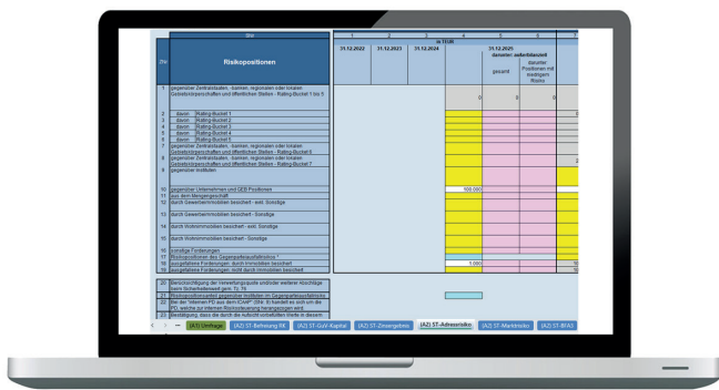
Exemplarischer Meldebogen 2026