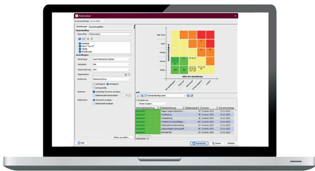
Steuerung der operationellen Risiken mit ORM/PROKORISK